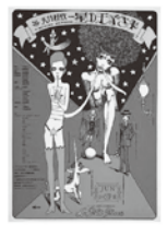
演劇実験室・天井棧敷 1968 「星の王子さま」 宇野亜喜良/シルクスクリーン