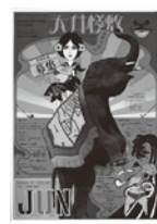
演劇実験室・天井棧敷 1967 「天井棧敷定期会員募集」 横尾忠則/シルクスクリーン