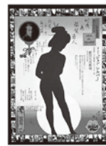
劇団状況劇場 1967 「ジョン・シルバー」 新宿恋しや夜鳴き篇 横尾忠則/シルクスクリーン