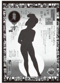
劇団状況劇場 1967 「ジョン・シルバー 新宿恋しや夜鳴き篇」 横尾忠則/シルクスクリーン

●ポスター解説ギャラリーツアー 3月3日(土) 14:00~ ツアー案内人 / 笹目浩之 (ポスターハリス・カンパニー代表) 3月18日(日) 13:00~