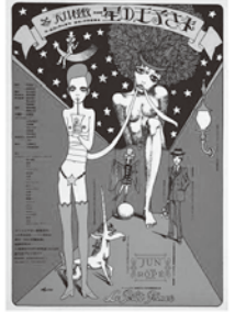
演劇実験室・天井棧敷 1968 「星の王子さま」 宇野亜喜良/シルクスクリーン

状況劇場、天井棧敷、黒テント、自由劇場、大駱駝艦など、1960~1980年代半ばにかけての演劇界は、いわゆる商業演劇とは一線を画した“アングラ”と呼ばれる劇団が勢いをもち、独特の世界を創りあげていました。そしてそれらの公演ポスターは、一流のアーティストの手によって創られ、熱いメッセージにあふれています。現在は美術的評価も高く、当時公演用に限られた数しか製作されなかったため現存するものは僅かです。当時のアングラ演劇の傑作ポスターを一同にご覧いただけるのは大変貴重な機会です。