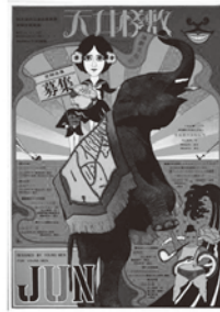
演劇実験室・天井棧敷 1967 「天井棧敷定期会員募集」 横尾忠則/シルクスクリーン