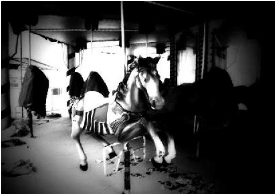
米内安芸出品作品

■招待作家/本山周平(写真家) 笹岡啓子(写真家) 北島敬三(写真家) 王子直紀(写真家) 西村康(写真家) 大友真志(写真家) ほか