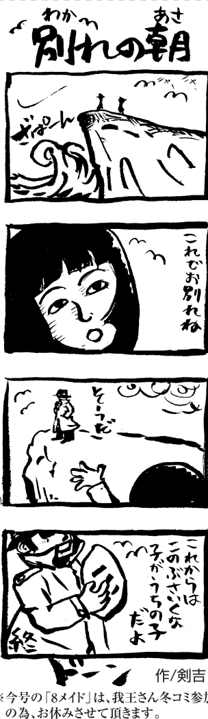
※今号の「8メイド」は、我王さん冬コミ参加の為、お休みさせていただきます。