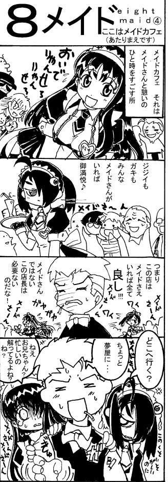
Presented by 我王