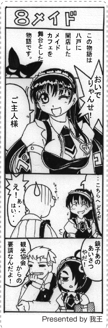
Presented by 我王